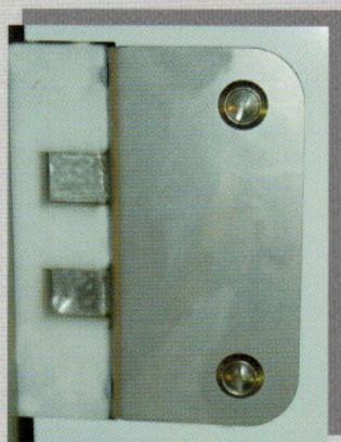
nouvelle charnière inox