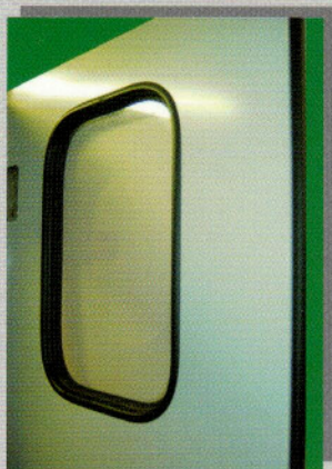
profil anti-pince doigt

passage effectif = LU - 5 cm ( 1 vantail ) passage effectif = LU - 10 cm ( 2 vantaux )